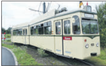
Mit der historischen Straßenbahn durch Freiburg: Die Tram-Oldtimer gehen am Samstag wieder auf Schiene.