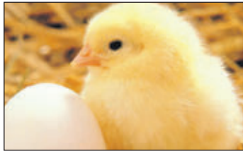
Zum traditionellen Bibilifest mit Rammler-Hock laden die Kleintierzüchter Umkirch am Wochenende.