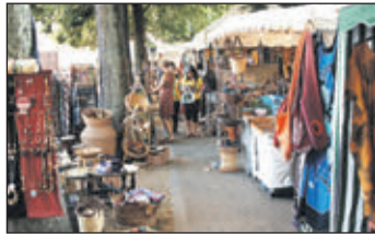
Beim „Bazar du Monde – Markt der Kulturen“ gibt es am Wochenende in Breisach viel zu entdecken.