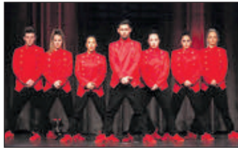
Die Hip Hop Company „Juvenile Maze“ hat sich für die WM in Las Vegas qualifiziert und lädt jetzt zur Spengengala.