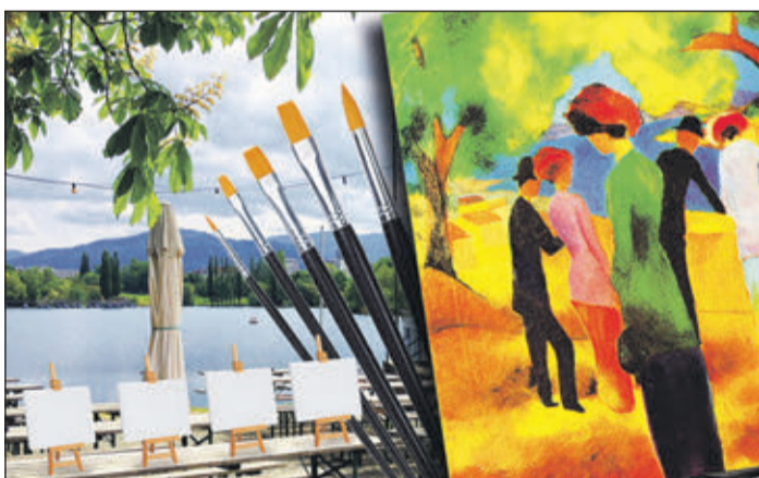
Die MalMeister verlagern das Atelier ins Freie. Im Biergarten Seepark malen die Teilnehmer August Mackes Werk nach.

Open-Air-Atelier am Seepark: August Mackes „Dame in grüner Jacke“ malen